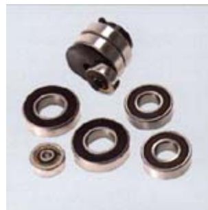
ドライバーアッセンブリー モーターベアリング