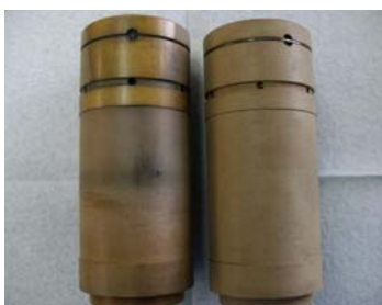
ディスプレイサー